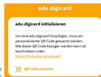
Abbildung 3: Aufforderung zum Scannen des QR-Codes

Die persönliche edu.digicard wird jetzt am Smartphone mit „edu.digicard initialisieren“ und „QR-Code scannen“ (QR-Code aus Punkt 2) aktiviert.